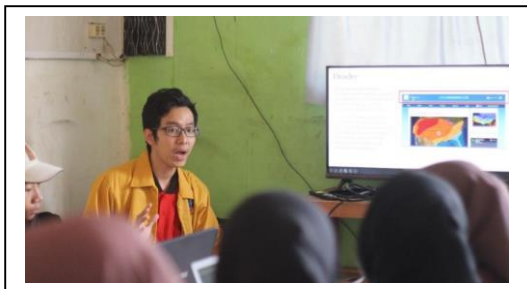
Gambar 3. Pemaparan materi pembuatan website

Berdasarkan dari 3 hasil evaluasi pada sesi pembelajaran ke-3 dan sesi pembelajaran ke-4 yang telah disebutkan sebelumnya, para peserta telah dianggap mampu dalam membuat dan merancang website sederhana dengan menggunakan tools yang ada di platform Wordpress. Berikut gambar 3 merupakan pemaparan materi pembuatan website.