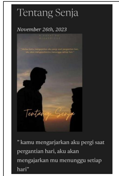
Gambar 4. Hasil desain Wordpress peserta

Berikut ini gambar 4 yang merupakan contoh hasil membuat postingan website oleh peserta dengan menggunakan Wordpress: