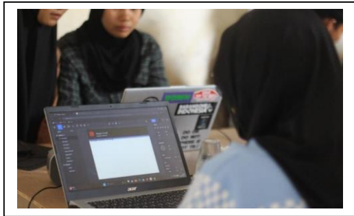
Gambar 1. Praktik desain kerangka web dengan Figma

Berdasarkan dari 4 hasil evaluasi pada sesi pembelajaran ke-1 dan sesi pembelajaran ke-2 yang telah disebutkan sebelumnya, para peserta telah dianggap mampu dalam membuat desain website sederhana dengan menggunakan tools yang ada di aplikasi Figma seperti pada gambar 1 dibawah ini.