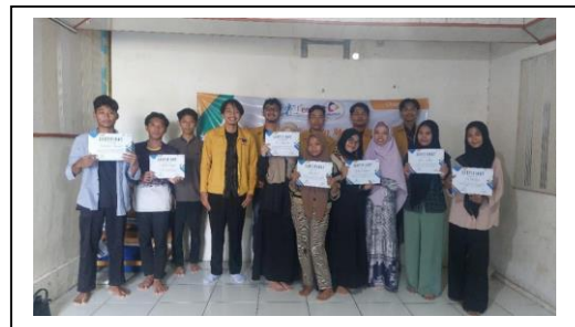
Gambar 5. Penyerahan sertifikat kepada peserta

Dengan melihat seluruh poin hasil evaluasi di sub-bab sebelumnya, maka seluruh sasaran kegiatan atas rumusan masalah yang diberikan telah terpenuhi dengan baik. Sebagai reward terhadap kemampuan peserta, tim PKM memberikan sertifikat seperti pada gambar 5 berikut.