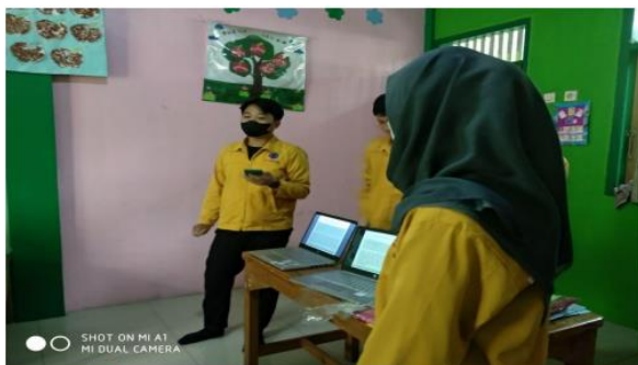
Gambar 3. Pemaparan Materi Tentang Internet