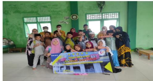
Gambar 5. Penutupan dan Foto Bersama

mengetik. Dan di hari terakhir ini sekaligus penutupan Pengabdian Kepada Masyarakat dan tak lupa menghadap ketua yayasan pendidikan islam berterima kasih atas segala fasilitas dan tempat yang telah di tempatkan.