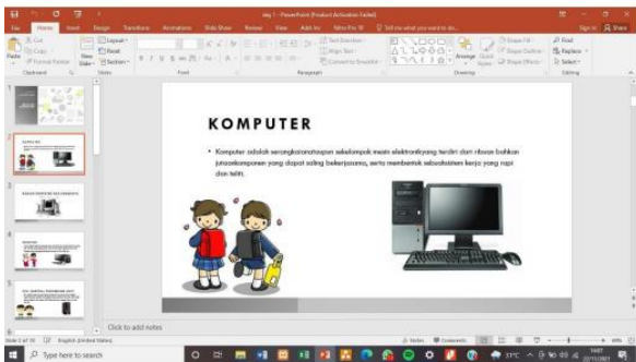
Gambar 2. Materi Pengenalan komputer