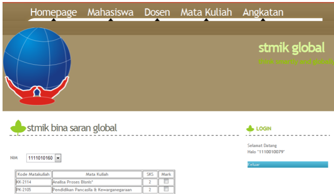
Gambar 3. Pembuatan KRS