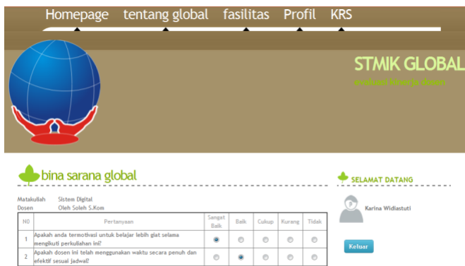
Gambar 4. Tampilan Pengisian Kuesioner