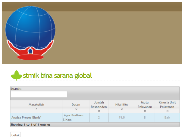
Gambar 5. Tampilan Pencetakan Laporan